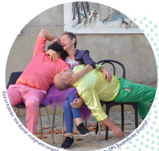
Ere habiter, trio dansé «soignant-soigné» avec La Halte-Gardejrie - EPS Barthélemy Durand

« Je n'aurais jamais imaginé faire de si belles rencontres dans un hôpital psychiatrique. Je ne savais pas non plus que la culture et la santé pouvaient être si intimement liées. La culture. Qu'est-ce que c'est la culture quand on a besoin de soins et que la vie est une difficulté douloureuse ? Qu'est-ce que la culture peut changer dans le quotidien des personnes soignées et des salariés d'un hôpital aussi vaste et aussi tentaculaire que l'EPS Barthélemy Durand ? Les réponses sont des noms d'artistes et de compagnies artistiques [...]. Les réponses sont aussi les courages et les timidités des patients qui, parfois vêtus d'un pauvre pyjama bleu, ont décidé, le temps d'une création artistique, d'être maîtres de leurs émotions et de leurs corps. Il en faut de la force et de la générosité pour parler dans un micro, tenir une caméra, peindre un nuage, se prendre pour Antigone, faire comme si on attendait Godot, écrire ensemble, dire les larmes cachées depuis si longtemps, rire aux éclats et chanter. Oui, chanter et danser encore parce que l'art qui entre à l'hôpital psychiatrique, ça donne envie de chanter, ça donne envie de danser. L'art est une joie. Une bulle de joie. Je suis joyeuse. » S.F.