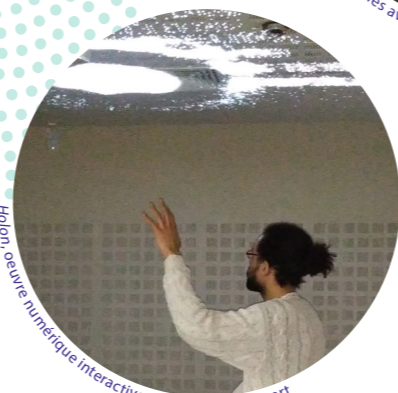
Hibou, œuvre numérique interactive, CH de Melun-Sénart