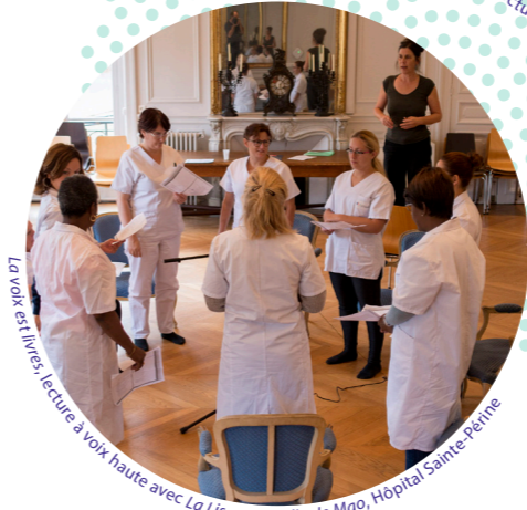
La voix est livrée, lecture à voix haute avec La Liseuse

« La poésie a le pouvoir de lâcher-prise, de lever les préjugés. »