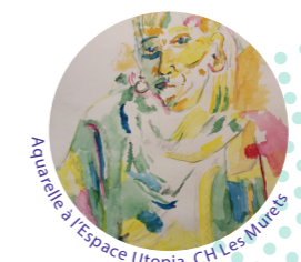
Aquarelle à l'Espace Utopia, CH Les Murets