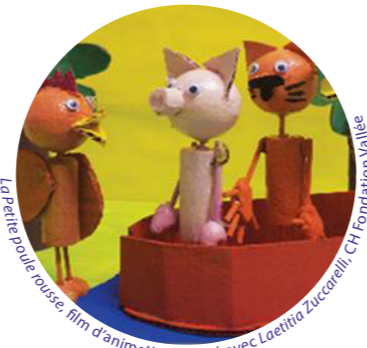
La Petite poule rousse, film d'animation réalisé avec Laetitia Zuccarelli, CH Fondation Vallée

« Je ne pensais pas qu'on irait aussi loin. »