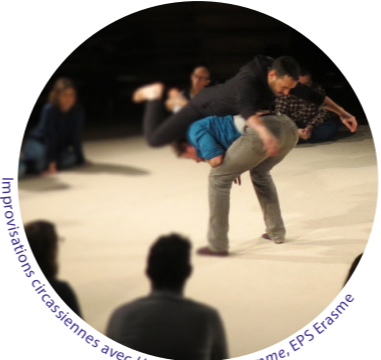
Improvisations circassiennes avec Un Loup pour l'homme, EPS Erasme