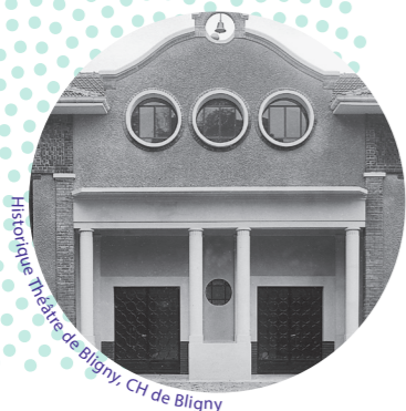
Hôpital de Bligny, CH de Bligny

« Je ne pensais pas qu'on irait aussi loin. »