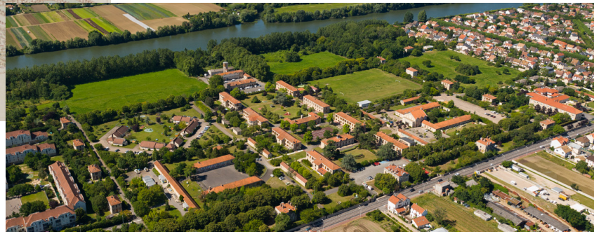
Le Centre Hospitalier (photo 2012)

A l'occasion des Journées du Patrimoine, le Centre Hospitalier Théophile Roussel de Montesson ouvre ses portes le samedi 15 septembre 2018.