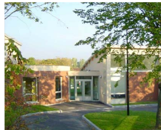
Unité Victor Hugo

L'unité peut accueillir des personnes hospitalisées sur demande d'un tiers ou hospitalisées d'office.