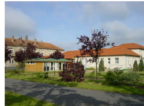
Unité Renoir - Montesson