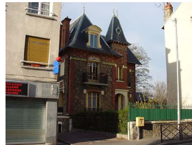
Hôpital de jour de Sartrouville

Adapté et personnalisé pour chaque patient.