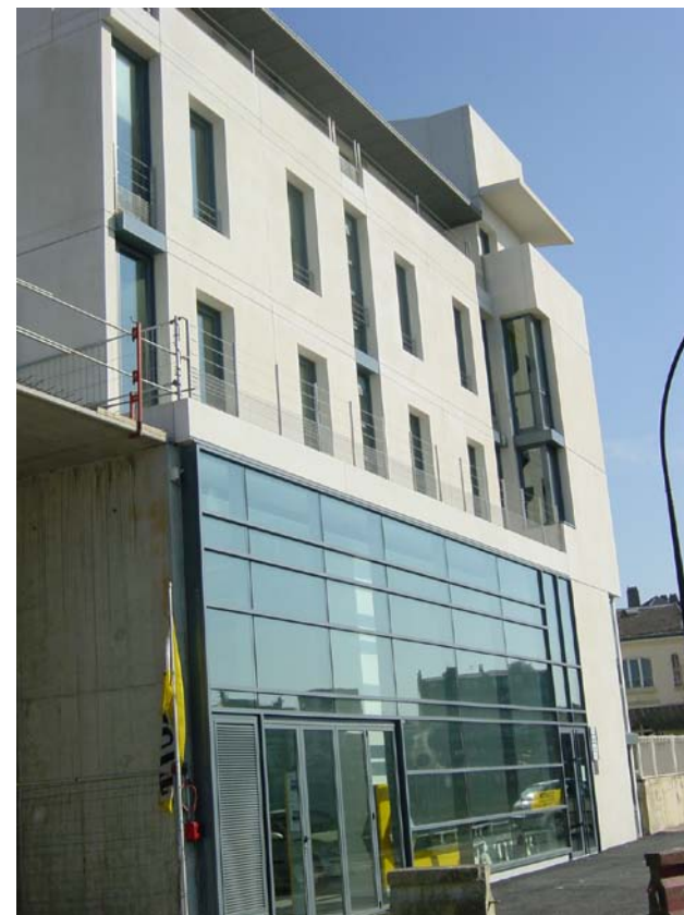
CMP de Maisons-Laffitte

Les admissions dans l'unité MONET peuvent être réalisées 24h/24h sur prescription médicale et/ou avis du médecin de garde.