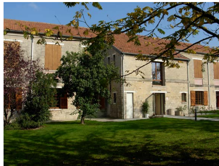
CMP Condorcet - Montesson

Les soins ne donnent pas lieu à un paiement mais sont pris en charge par l'assurance maladie.